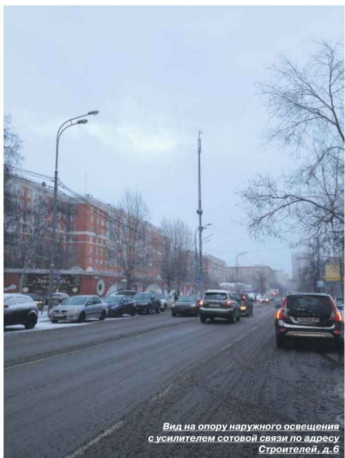
Вид на опору наружного освещения с усилителем сотовой связи по адресу Строителей, д.6

рожного движения всеми участниками, особенно мотоциклистами в ночное время;