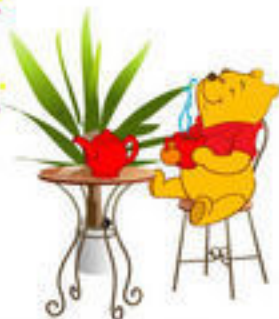
ОСТАВЛЕННЫЕ БЕЗ ПРИСМОТРА ЭЛЕКТРОПРИБОРЫ