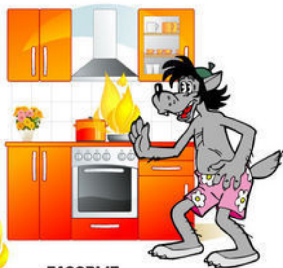
ГАЗОВЫЕ И ЭЛЕКТРИЧЕСКИЕ ПЕЧИ