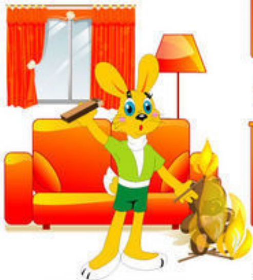
НЕОСТОРОЖНОЕ ОБРАЩЕНИЕ С ОГНЁМ